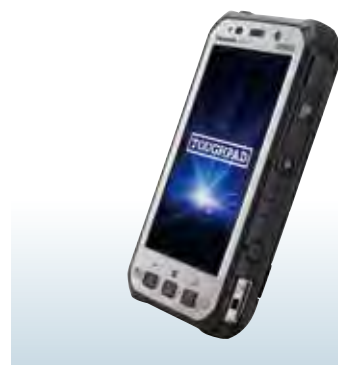
採用機種:タフパッド FZ-E1